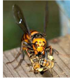
Vespa mandirinia (Japon dev eşek arısı)