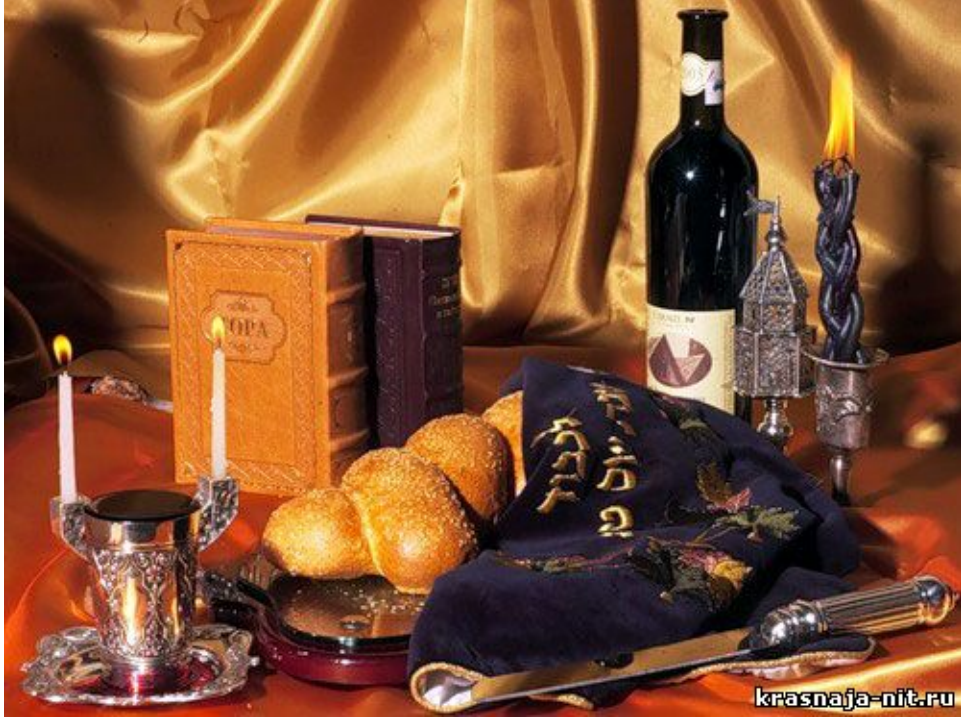
Yahudilerin Şabat Bayramına Özel Hazırladıkları Gefilte Fiş Yemeği