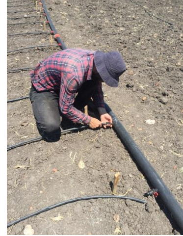
Şekil 3.2. Deneme alanında ekimle gübrelemenin yapılması ve sulama sisteminin kurulması

Fidelerin 3-4 yapraklı olduğu dönemde her ocakta sağlıklı fide kalacak şekilde tekleme işlemi gerçekleştirilmiştir. Bitkiler 40-50 cm boylandığında, azotlu gübrenin ikinci yarısı (15 kg N/da) verilmiş ve ardından boğaz doldurma işlemi (26.07.2017) yapılmıştır (Şekil 3.3). Denemede yaprak biti ve koçan kurdu zararına karşı etken maddesi 141g/l Thiamethoxam + 106 g/l Lambda-cyhalothrin olan EFORIA 247 SC adlı kimyasal kullanılmıştır. Deneme alanında yabancı ot mücadelesi el çapası ile yapılmıştır.