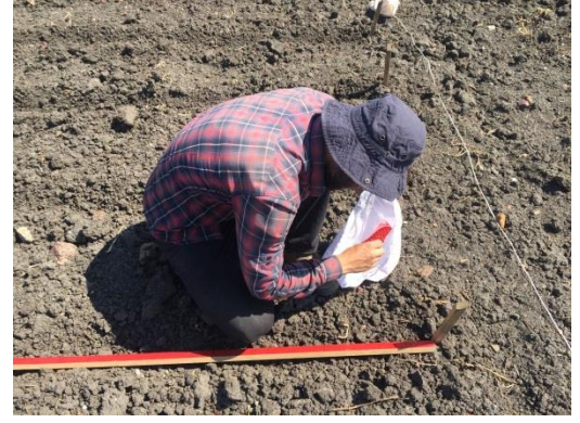
Şekil 3.1. Deneme alanında elle ekimin yapılması