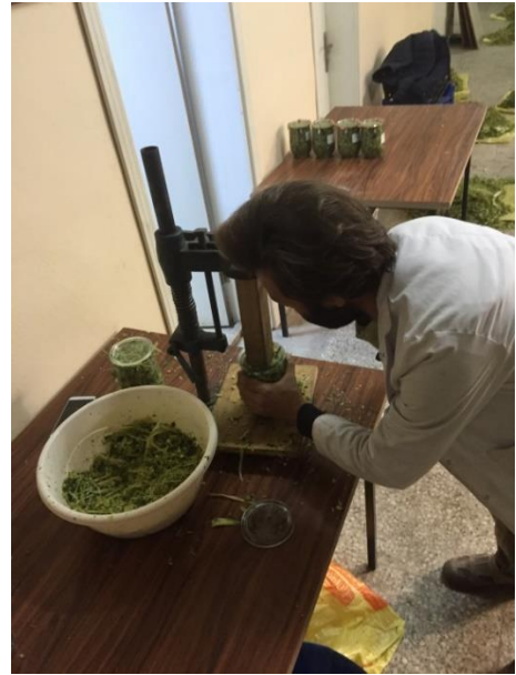
Şekil 3.5. Silaj kavanozlarının hazırlanması