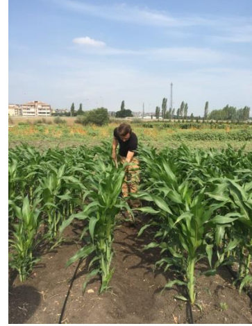
Şekil 3.3. Deneme alanında gübreleme ve boğaz doldurma işlemleri