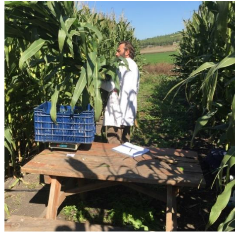
řekil 3.4. Deneme alanında hasadın yapılması

Kuru madde verimi (kg/da): Hamur olum dneminde her parselden iki bitki drneėi alınmıř, tartılmıř ve bu drnekler kurutma dolabında 70 °C'de 48 saat kurutulmuřtur. Kurutulan drnekler tartılarak kuru madde oranları hesaplanmıřtır. Elde edilen kuru madde oranları yeřil ot verimleri ile arpılarak kuru madde verimleri hesaplanmıřtır.