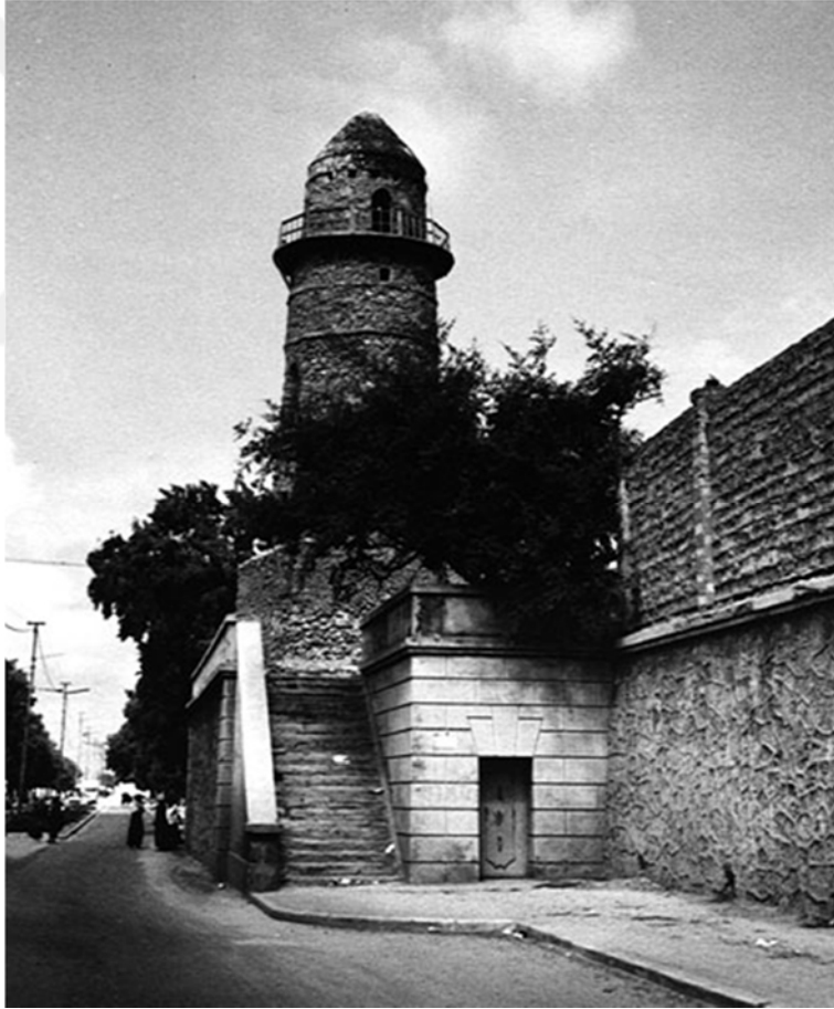
Mogadişu'da Abdülaziz Camii

Mogadişu'da bulunan Fahreddin Camii miladi on üçüncü yüzyılda inşa edilmiştir. Bu camide İslâmîyet hakkında ilimler öğrenen öğrenciler, bu dinin Mogadişu dışında yayılmasında büyük rol oynamıştır. 77 Gerçekten de Hz. Muhammed'in (as) hayatında Medine'de olduğu gibi, camiler İslâm'ın ulaştığı her yerde, dinin tebliğine büyük katkı sağlamıştır.