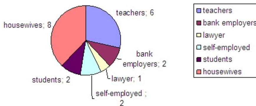
Figure III: Distribution of the participants according to their occupations

housewives. Their interlocutors consisted of 3 teachers, 1 bank employer, 1 lawyer, 2 students, 1 self-employed and 3 housewives. All the fortune-tellers knew their interlocutors previously, so power and social distance in their interaction could possibly play a different kind of role in comparison to other interactants who did not know one another previously.