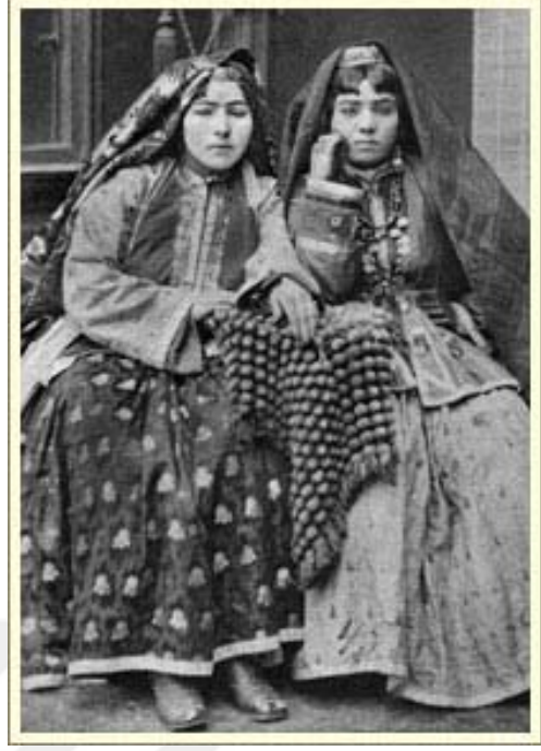
12. Şirvan yöresine ait bayan kıyafetleri (Şamahı ve Bakü)