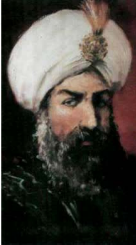
9. Derbendiler hanedanının kurucusu Şeyh I. İbrahim