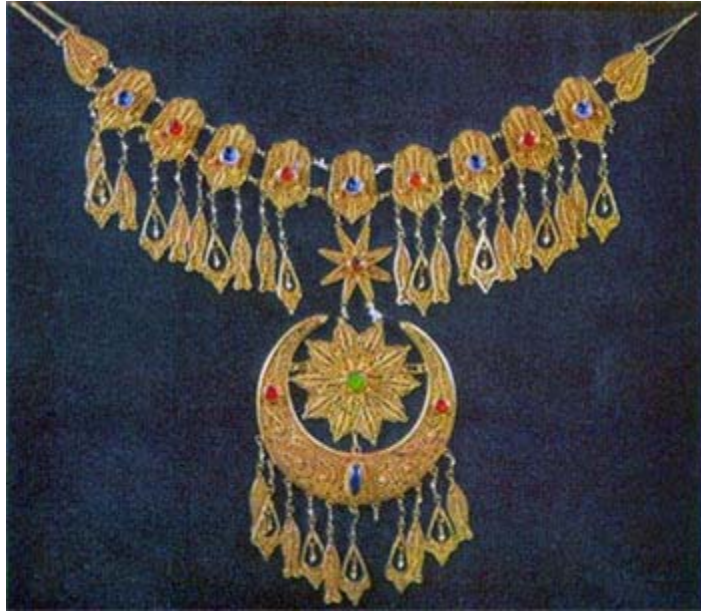
16. Ortaçaęa ait Őirvan bayan takısı