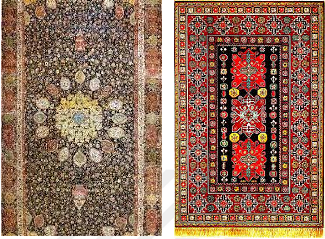
15. Őirvan halıları