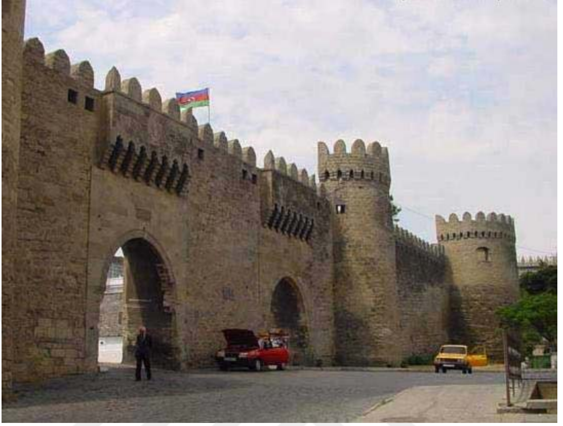
6. Bakü kalesinin giriş kapıları