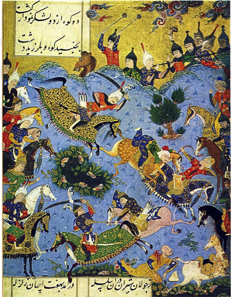
11. Cabanı Savaşını tasvir eden bir minyatür (Ferruh Yasar ile Şah İsmail arasında)