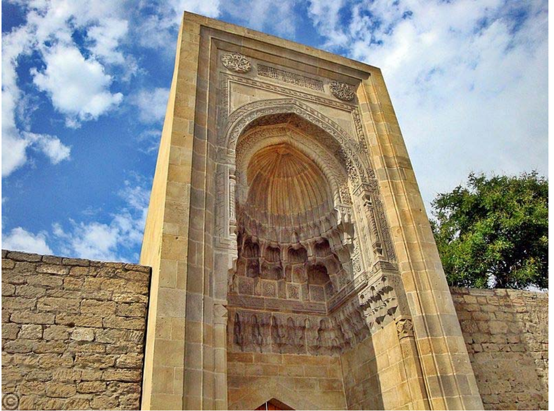
7. Şirvanşah sarayında Osmanlı Sultanı III. Murad adına yapılmış kapı