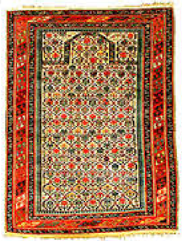
14. Şirvan halıları