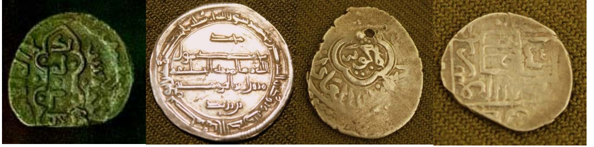
10. Şirvanşah sikkeleri