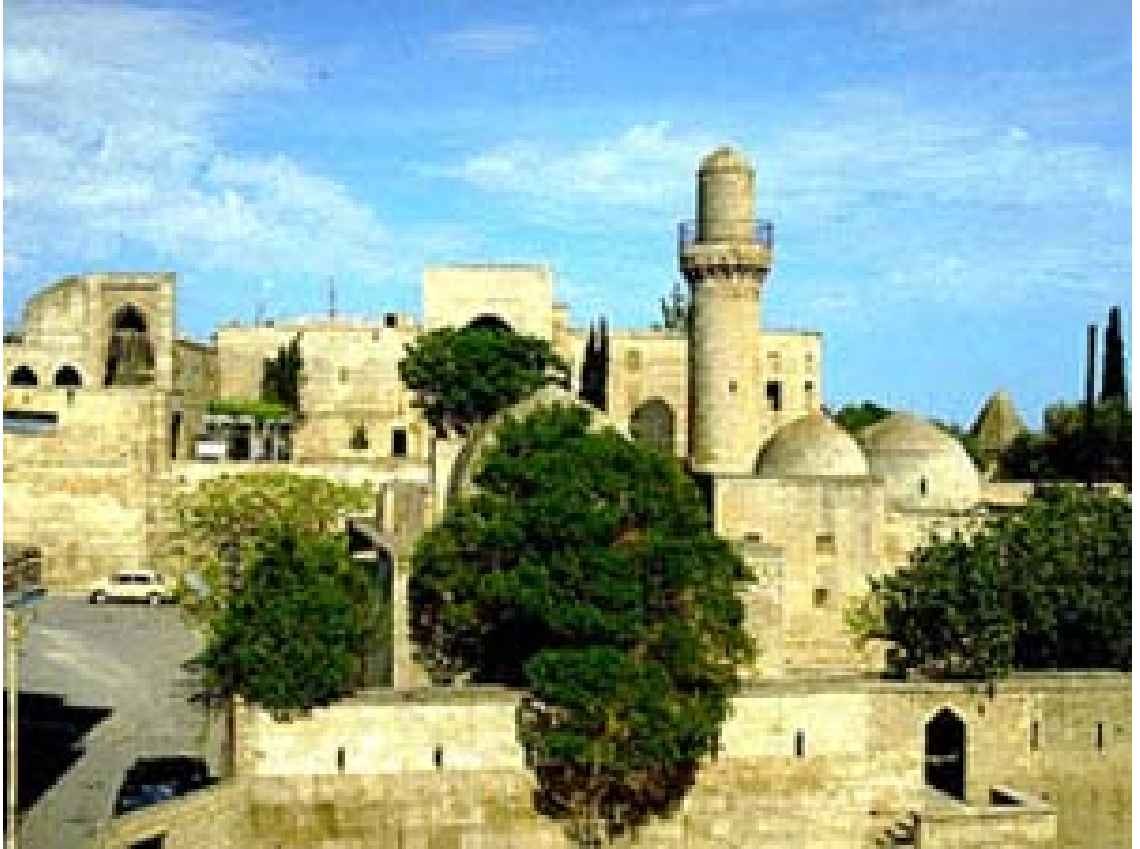
5. Şirvanşahlar sarayı külliyesinden bir görüntü